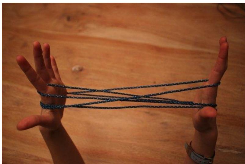
Abnehmspiel: das "Katzenkörnchen"