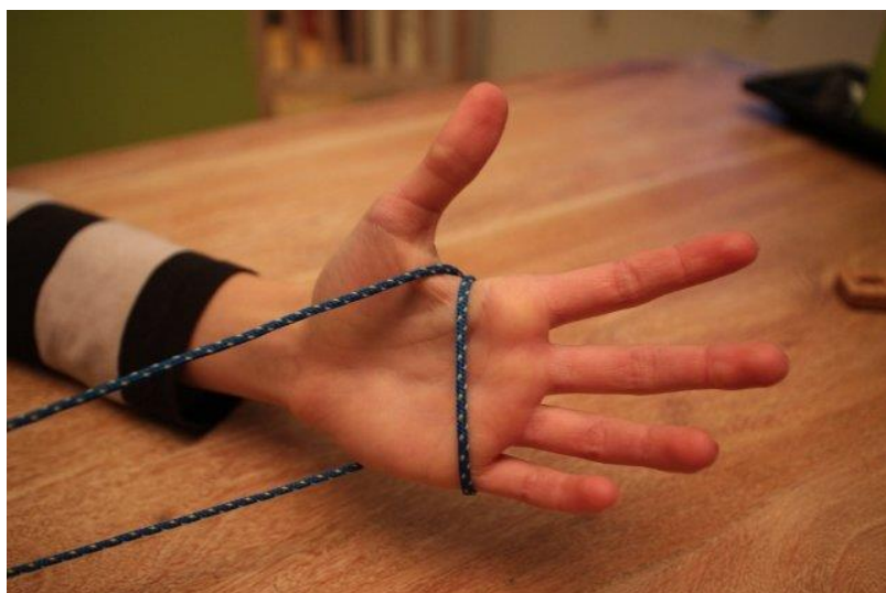
Abnehmspiel: Ausgangsposition Schlaufe